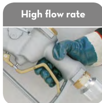
High flow rate